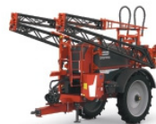
Protezione delle Colture