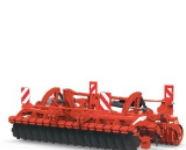
Lavorazione del terreno