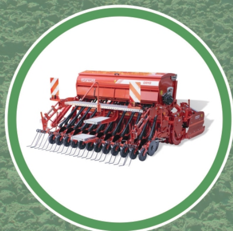
Seminatrice DAMA PLUS