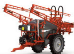
Campo 15-20 C